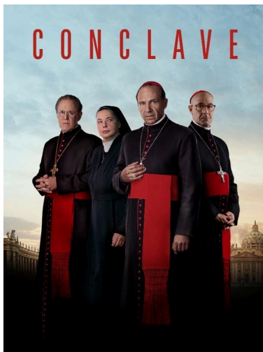
Film 'Conclave': de kerk als bedrijf

Boven hen het plafond met de fresco's van Michelangelo, met de beroemde scheppende hand van God. Twee keer per dag stemmen de heren (want er zijn nog geen dames door het rode kardinaalsplafond gebroken). Tussen de bedrijven door wordt er onderhandeld, gemanipuleerd, gehanteerd. Als er geen vereiste meerderheid is voor een kandidaat, volgt een nieuwe kiesronde. Na elke stemming worden de stembriefjes van de kardinalen verbrand. Nog geen paus? Dan gooit men er nat stro bij. Buiten zie je dan zwarte rook kringelen uit een schoorsteentje: 'Ze zijn er nog niet uit'. Zijn de kardinalen het eens, dan produceren de stembriefjes de befaamde witte rook. Iedereen buiten ziet: 'Er is een nieuwe paus!'.