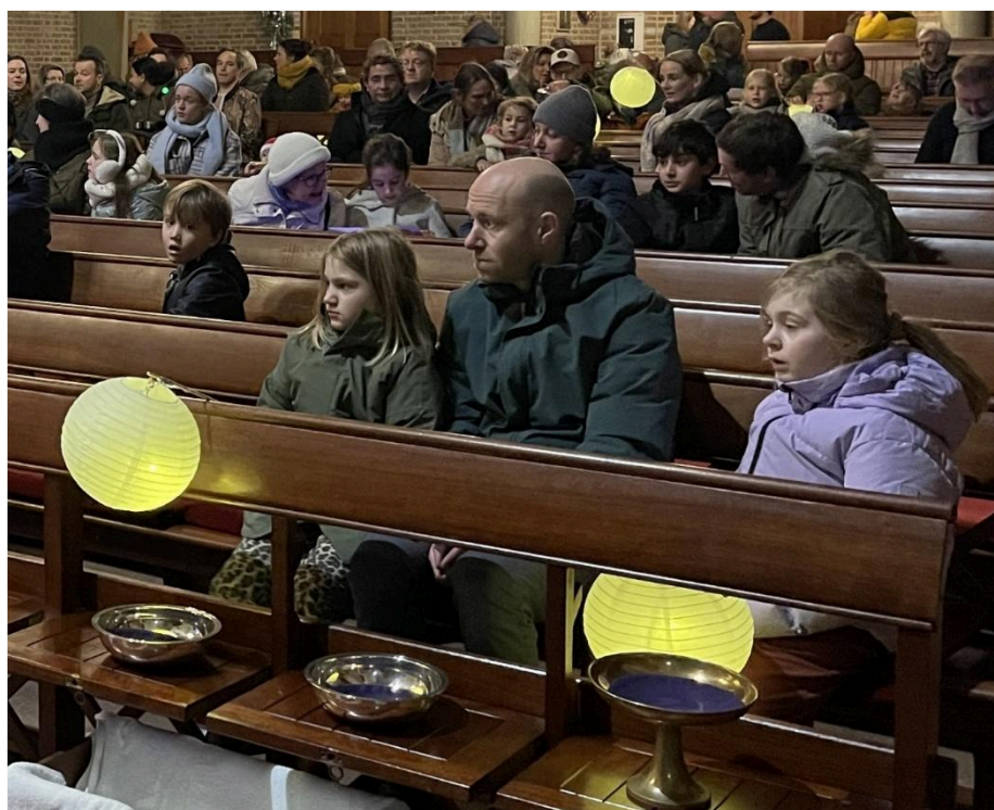
Impressies van de Andreaskerk in de Advent- en Kerstperiode