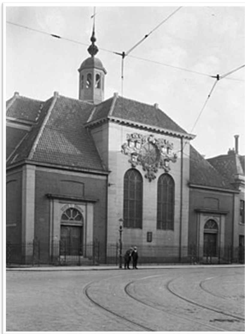
Scots International Church Rotterdam 1657/1697/1940

Wel zijn er op een aantal plaatsen nog zeemanshuizen, ook in Rotterdam. De Schotse en Anglicaanse kerk waren de eerste stichters van kerken voor zeevarenden in Rotterdam. De Scandinavische lutherse kerken kwamen er later mee. De Scots International Church van 1657/1697 aan het Vasteland had veel weg van onze oude kerk aan de Wolfshoek en is in WO II verloren gegaan.