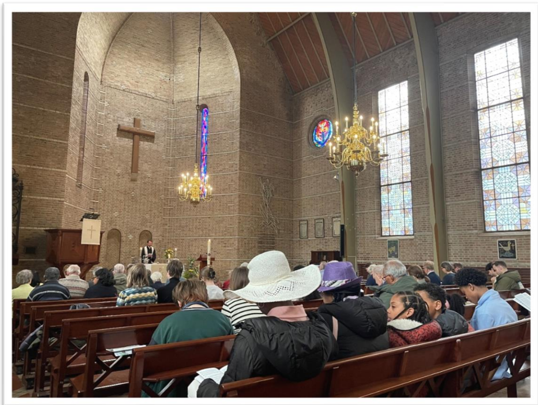
Paasmorgen 2024 in de Andreaskerk

Weet u altijd welkom om namen te schrijven in het voorbedenboek bij de ingang van de kerk.