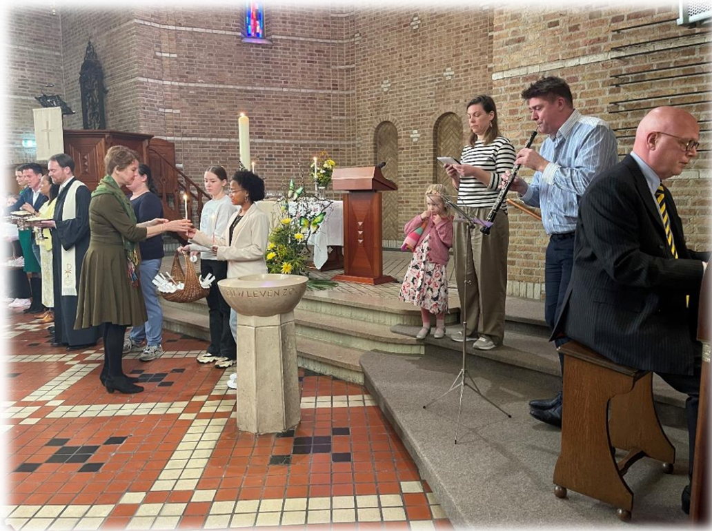
Paasmorgen: muzikale kerk