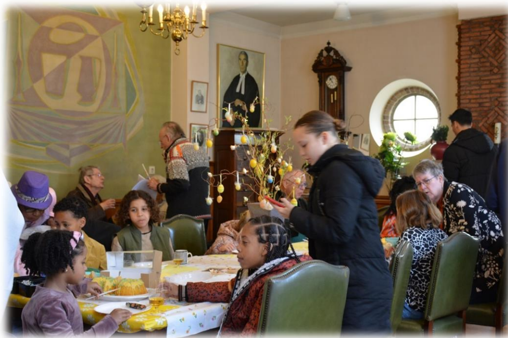
Paasbrunch: creatieve kerk