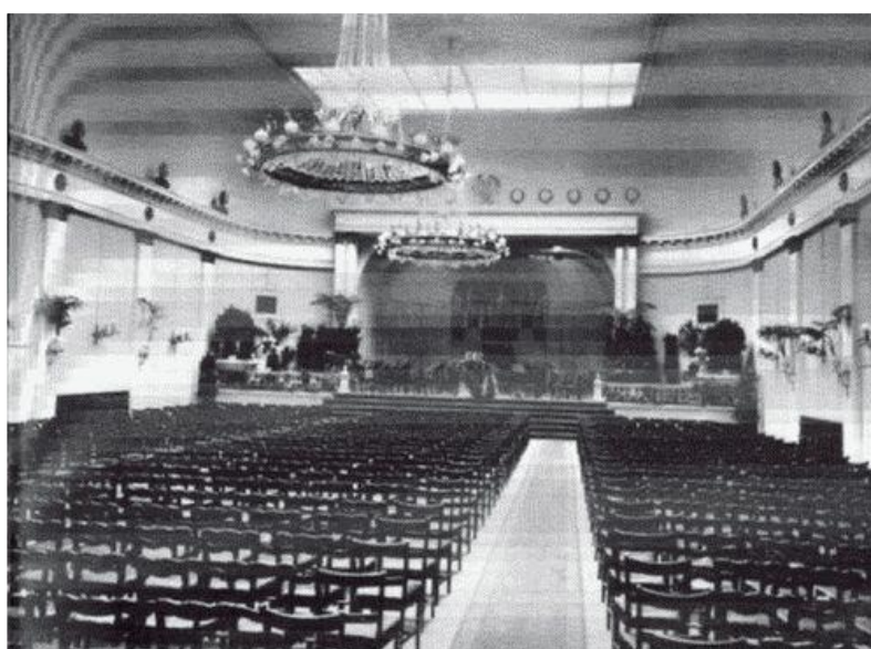
De 'Groote Doele' aan de Coolsingel Podium van Nederland's eerste Matthäus Passion in 1870.

De tijd van de muziekpassies komt er weer aan. Nergens is de Matthäus Passion van Bach zo populair als in Nederland. Weinig mensen weten, dat die in Nederland voor het eerst werd uitgevoerd in....Rotterdam! Dat was op 22 april 1870, in de 'Groote Doele'. Onder leiding van dirigent Woldemar Bargiel, zong het koor van de afdeling Rotterdam van de Maatschappij tot Bevordering der Toonkunst Bachs meesterwerk. Waarschijnlijk met een ensemble van gelegheidsmuzici, zoals je die in de negentiende eeuw veel had. In ieder geval niet met het Rotterdams Philharmonisch Orkest, want dat stamt 'pas' uit 1918. Het Philharmonisch Koor Toonkunst, zoals het nu heet, is springlevend en zingt geregeld grote oratoria en bijzondere koorwerken.