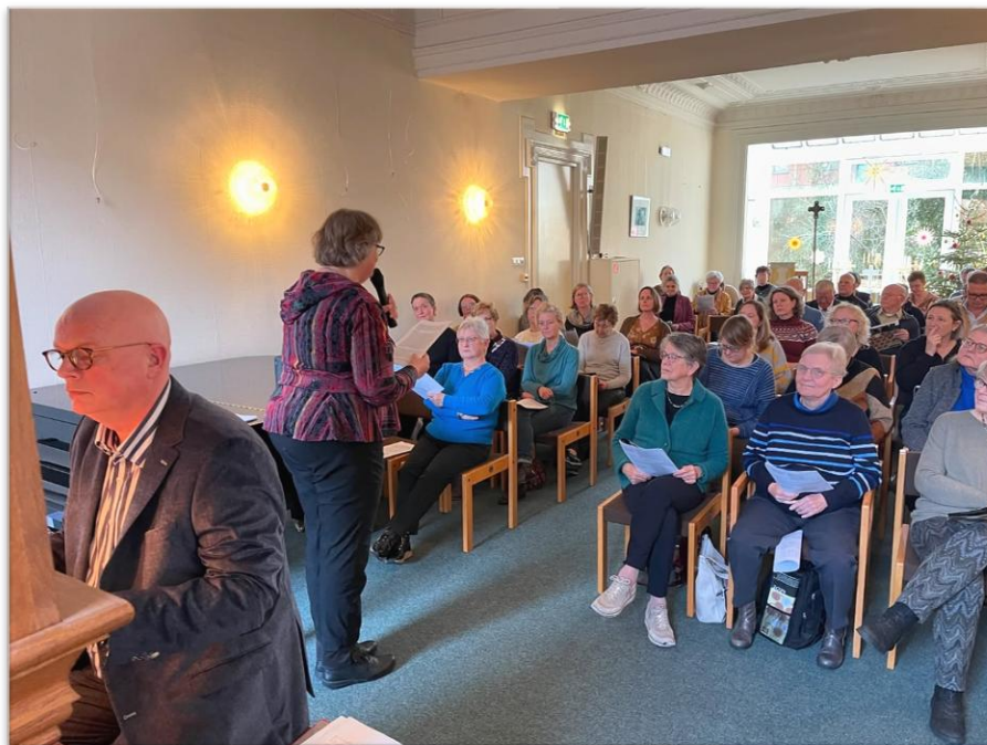
Zingen met Luther en Bach