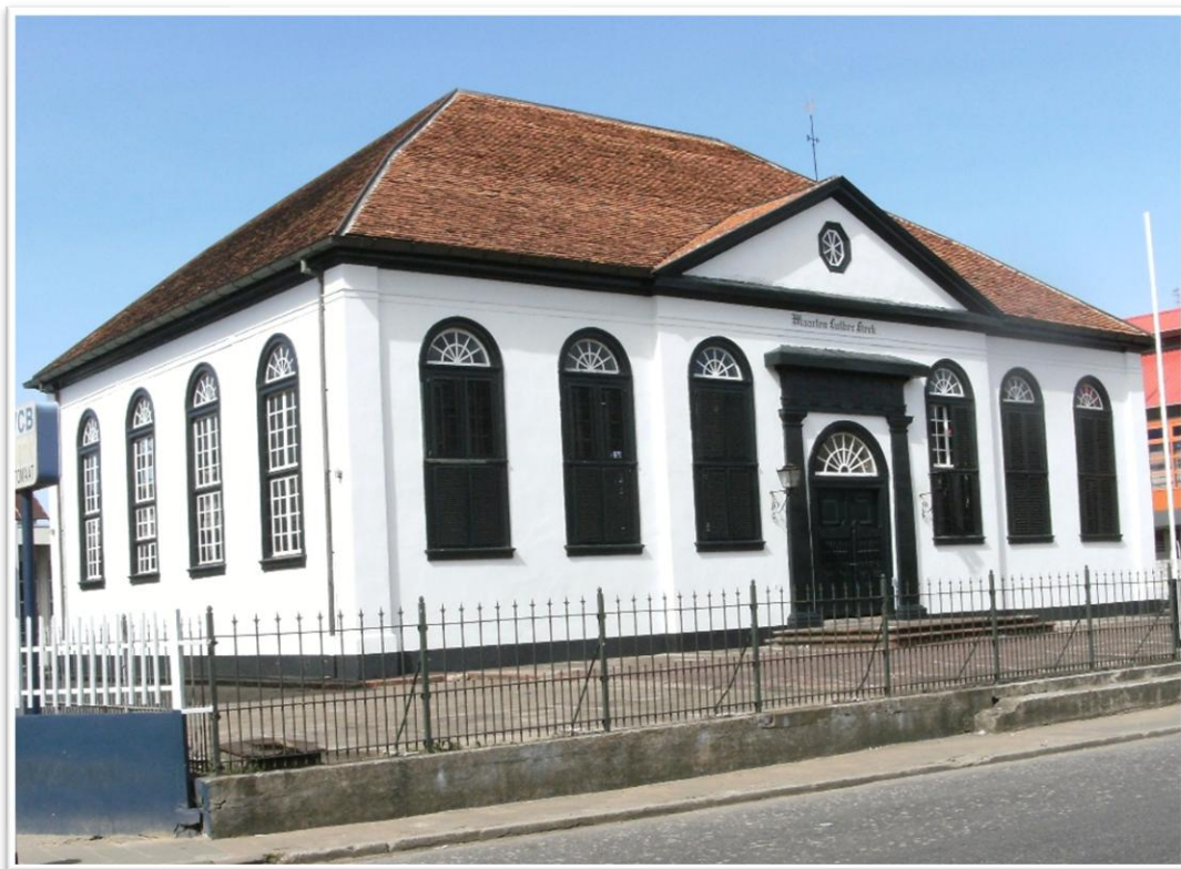
Maarten Lutherkerk Paramaribo.

De diaconie heeft de afgelopen maanden niet stilgezeten. Eerst willen we iedereen bedanken voor de gulle bijdragen aan de Vleeschcollecte tijdens Kerst. De opbrengst was € 975,-, een prachtig bedrag dat we zullen gebruiken voor de allerarmsten. In deze periode melden we eenoudergezinnen en alleenstaande senioren aan voor een vakantieweek in het komende seizoen. Dit doen we samen met de Stichting Lutherse Ontspanningsinitiatieven en Activiteiten (SLOA). We hopen de vakantiegangers een zorgeloze week te bieden, waarin ze echt kunnen ontspannen. Wilt u in de toekomst ook in aanmerking komen voor zo'n weekje weg, of kent u iemand die dit goed kan gebruiken? Laat het ons weten via vakantie@luthersrotterdam.nl . Tot slot is het waardevol om te vermelden dat we de banden met Suriname en de Maarten Lutherkerk hebben aangehaald.