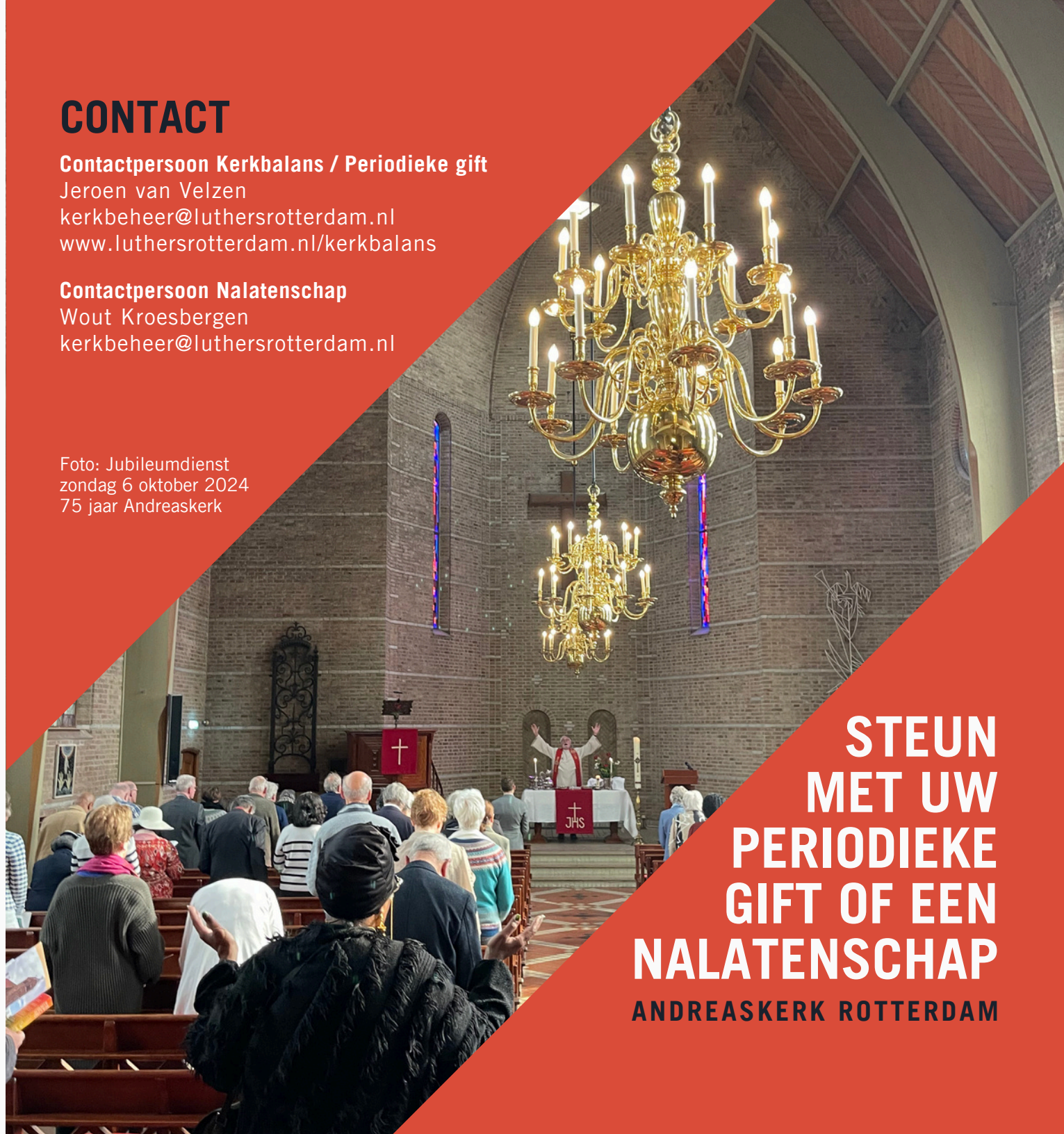
Jubileumdienst zondag 6 oktober 2024 75 jaar Andreaskerk

STEUN MET UW PERIODIEKE GIFT OF EEN NALATENSCHAP ANDREASKERK ROTTERDAM